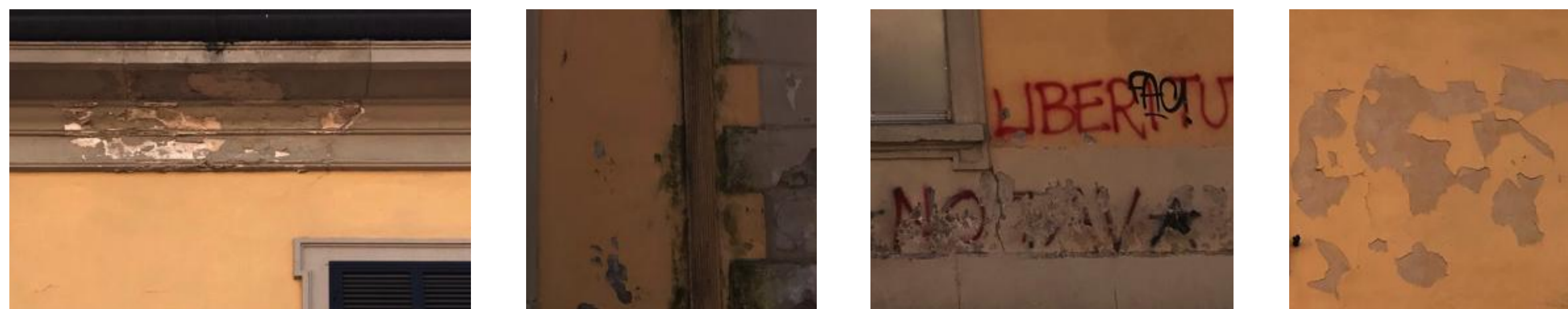
TIPOLOGIA DEI FENOMENI DI DEGRADO RICORRENTI